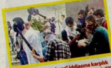
"Sivilere ateş açılıyor" iddiasına karşılık Silopi'de çekilen fotoğraflar "bunlar mı sivil?" yorumuyla sosyal medyada paylaşıldı.

Şırnak Silopi'de sokaklara açılan hendekleri kapatmak isteyen güvenlik güçlerine düzenlenen saldırıda 3 terörist, biri ağır 2 polis memuru ile 5 kişi yaralandı.