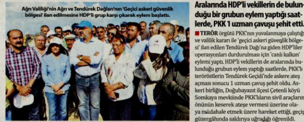
Ağrı Valiliği'nin Ağrı ve Tendürek Dağları'nın 'Geçici askeri güvenlik bölgesi' ilan edilmesine HDP'li grup karşı çıkarak eylem başlattı.

PKK ve gençlik yapılanması YDG-H'ye yönelik operasyonun başlatılmasıyla birlikte sosyal medyada, olaylarla ilgiliymiş gibi gösterilen birçok asılsız görsel paylaşıldı. Teröristlerin açtığı ateş ve atıldığı molotoflar sebebiyle alev alan trafoda konulan güvenlik güçleri tarafından yakılmış gibi göstermeye çalışılan hesapların yalanı kısa sürede ortaya çıktı. YDG-H'ye ait hesapların paylaşılması yüzü maskeli, ağır silahlı kişilere ait görüntülerle rağmen, güvenlik güçlerinin sivil halka ateş açtığı algısı oluşturulmaya çalışıldı.