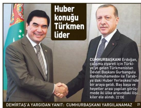
DEMİRTAŞ'A YARGIDAN YANIT: CUMHURBAŞKANI YARGILANAMAZ

KALASNIKOFLAR, EL BOMBALARI GÜVENLİK birimlerinin tespitlerine göre, terör örgütü PKK "Şehir savaşı"na hazırlık amacıyla kentlerdeki evlerde 80 bin uzun namlulu silah depoladı. Özellikle Hakkâri, Şırnak, Ağrı gibi illerde yoğunlaşan yığınakta başlıca Kalasnikof, pompalı tüfek ve tabancalar çekiyor. Bunların yanında el bombaları da saklanıyor. YERLERİ TEK TEK BELİRLENDİ PKK'NIN silahları hangi evlerde depolandığı, hangi adreste kaç adet ve ne marka silah olduğu tek tek belirlendi. MGK'da değerlendirilen bu duruma karşı kapsamlı bir strateji geliştirildi. Önümüzdeki dönemde geniş bir iç güvenlik hareketi başlatılacak, silahlar birer birer toplanıp imha edilecek.