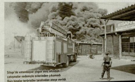
Silopi'de vatandaşlar yağın ateş altında kaldıkları çatışmalar nedeniyle evlerinden çıkamadı. Bazı binalar teröristler tarafından ateşe verildi.

Şırnak Valiliği, Silopi ilçesi'nde meydana gelen olaylarda 3 kişinin öldüğünü, biri ağır 2 polis ile birlikte toplam 7 kişinin yaralandığını açıkladı. Ölenlerden ikisininin 17 yaşındaki Mehmet Hidir Tanboğa ile 58 yaşındaki Hamdin Ulaş olduğu öğrenildi. Yaralıların durumlarının iyi olduğu belirtilirken, yaralı polislerin kaldığı hastane konuşunda bilgi verilmedi.