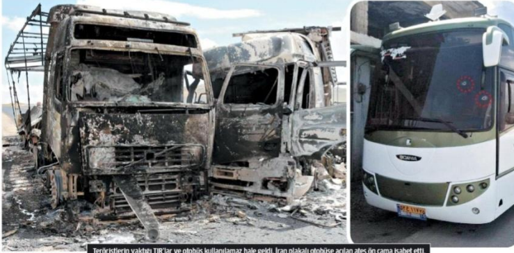
Teröristlerin yaktığı TIR'lar ve otobüs kullanılmaz hale geldi. İran plakalı otobüse açılan ateş ön cama isabet etti.

PKK'lı teröristler Ağrı Tendürek'te 3 TIR ve iki kamyonu yaktı. Bir yolcu otobüsüne ateş açan teröristler, 3 kişiyi yaraladı. TIM'e roketatar ve uzun namlulu silahlarla saldıran PKK'lılar bir uzman çavuşu şehit etti.