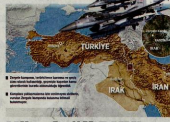
Zirgen kampının, teröristlerce barınma ve geçici ateş üssü haline gelmesi, güvenlik kuvvetleri tarafından operasyonlarla ortadan kaldırılmaya çalışılmaktadır.

AB'nin Ankara ile Öcalan arasında görüşmelerin ilerlemesi ve bir ateşkes için baskı yapmasını isteyen HDP Eş Başkanı Selahattin Demirtaş, NATO'ya da Kuzey Irak'taki PKK hedeflerini yönelik Türk operasyonlarına karşı tepki koymaya davet etti. Eş Başkanı, onlarca güvenlik görevlisini şehit eden ve halkın huzurunu tehdit eden terör örgütü PKK'ya karşı yürütülen operasyonun adil olmayan ve dayanılmaz bulunmayan bir savaş olduğunu söyledi. Demirtaş'ın PKK ile ilgili "barışçı" söylemleri ifade ettiği saatlerde, PKK'nın teröristleri Siirt'te havallanma ait VOR istasyonunu yaktı.