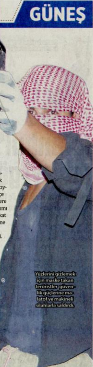
Yüzlerini gizlemek için maskeli teröristler, güvenlik güçlerine molotof ve makişin silahlarla saldırdı.

Teröristler tarafından güvenlik güçlerine ateş açılması sonucu çıkan çatışmada biri ağır olmak üzere 2 polis memuru yaralandı, çatışma esnasında 3 terörist öldü, 5 kişi de yaralandı. Çatışmalar devam ederken, İlçe Jandarma Komutanlığı'na ait birlikler de zorlu araçlarla ilçe merkezine inerek, stratejik noktalarda konuşlandılar. Helikopterler de havadan denetim yapmaya başladı.